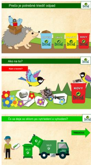
Prezentácia pre MŠ