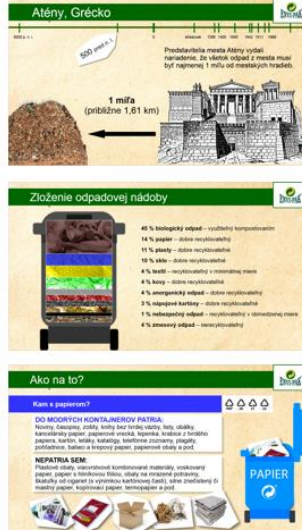
Prezentácia pre ZŠ