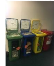
Edukačné koše s príkladmi recyklátov