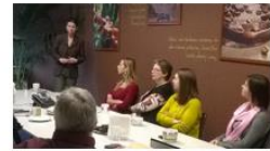
Pomôcky pre pedagógov