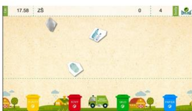
Aplikácia – hra na triedenie